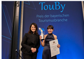
Bayerischer Tourismuspreis - Jetzt bewerben!

Herzliche Grüße aus Kempten, Ihr Team der Allgäu GmbH