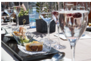
Bodenmöser Moor