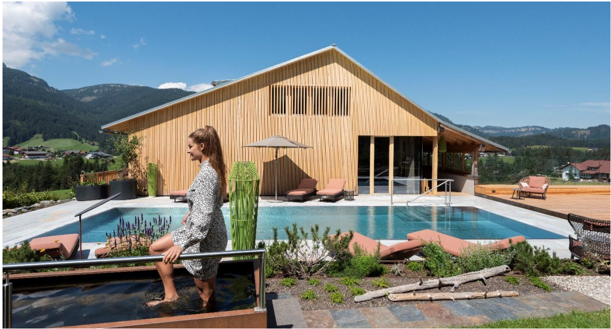
© Hermann Rupp, Bio-Hotel Oswalda Hus, Kleinwalsertal