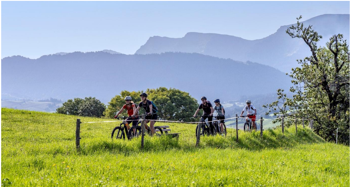
© Moritz Sonntag, Hotel Allgäu Sonne, Oberstaufen