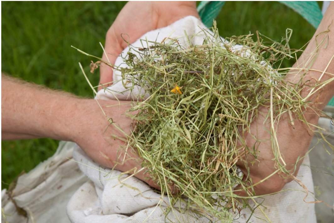
Wirkstoffe direkt von der Wiese: Bei vielen der Partnerhotels, wie hier im Biohotel Eggensberger kommt das Heu in Spa-Anwendungen zum Einsatz.

Zum Angebot der Naturwellness Allgäu gehören folgende Partnerhotels: