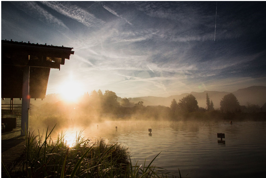
Wasser fürs Wohlbefinden: Das Haubers Naturresort bietet im „Haus am See“ naturnahes Schwimmerlebnis im eigenen Badeteich. ©Haubers Naturresort

Gastgeber, die die allgäutypische Offenheit gegenüber der Kraft der Natur leben.