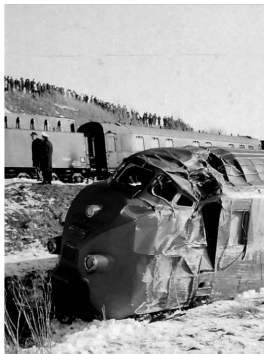
Abbildung: Feuerwehrmuseum Kaufbeuren