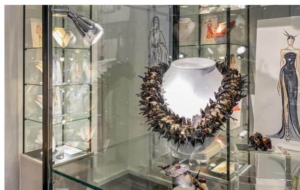
Abbildung: Erlebnisausstellung der Gablonzer Industrie