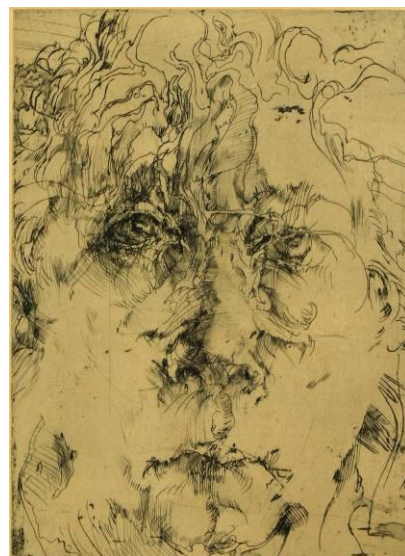
Abbildung: Horst Janssen, O.T. (Selbstportrait), 1973, Courtesy Stadtmuseum Kaufbeuren, Sammlung Horst Janssen

Weitere Informationen: www.kunsthhaus-kaufbeuren.de